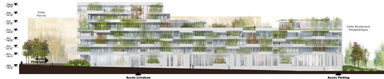
Illustration : Brenac &amp; Gonzalec