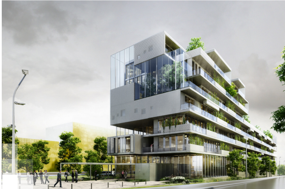
Illustration : Brenac &amp; Gonzalec