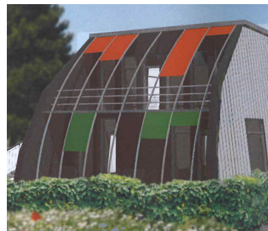
Illustration : Atelier d'Architecture Ecologique