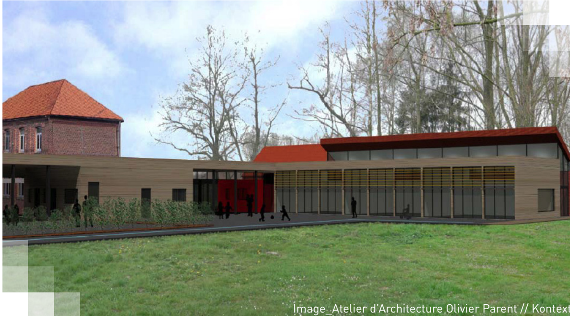
Image_Atelier d'Architecture Olivier Parent // Kontext