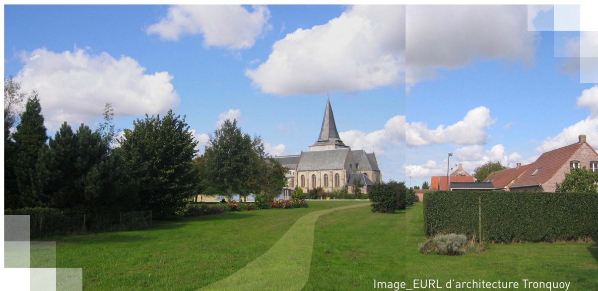
Image_EURL d'architecture Tronquoy