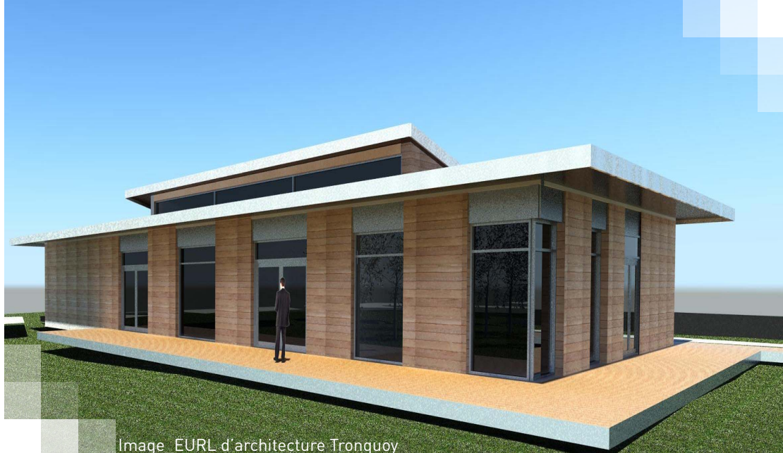
Image_EURL d'architecture Tronquoy